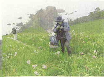
鹿の子百合自生地巡り